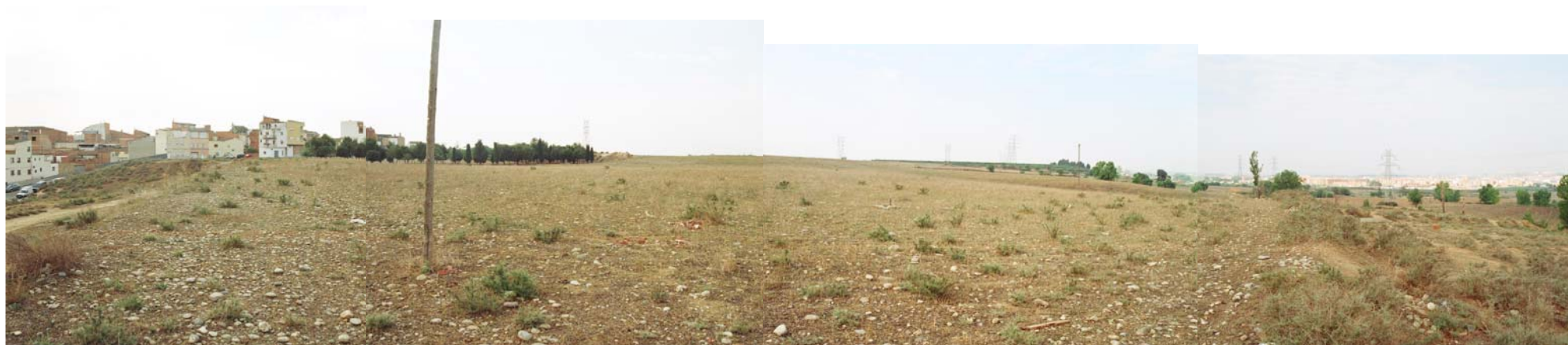
Vista des del Nord-Oest. A la dreta el barri dels Mangraners. Zona verda existent al costat del Carrer del Camp.