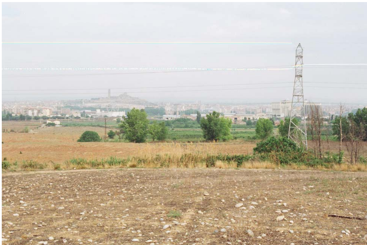
Vista des de la cota 195 cap a Lleida. Terrenys de l'àmbit del Pla i sèquia que voreja el sector pel sud-oest, en primer terme.