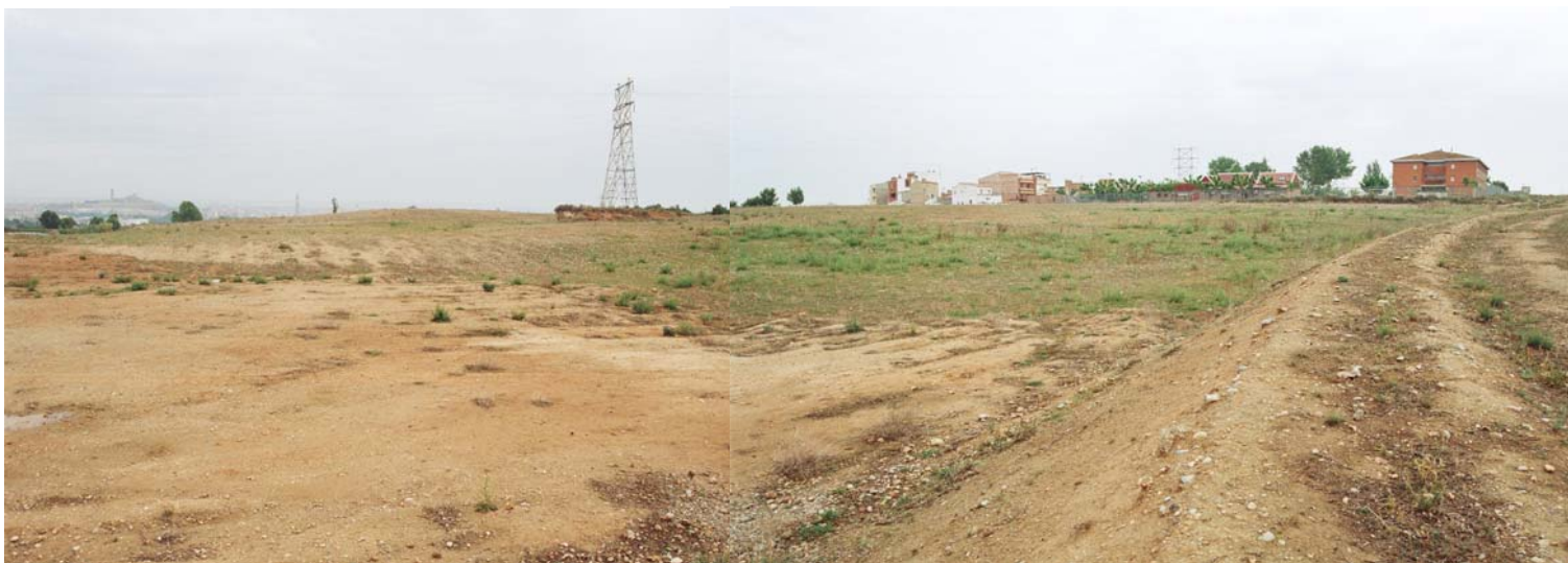
Vista des del Sud-Est en direcció al barri dels Mangraners. Col·legi Públic dels Mangraners.