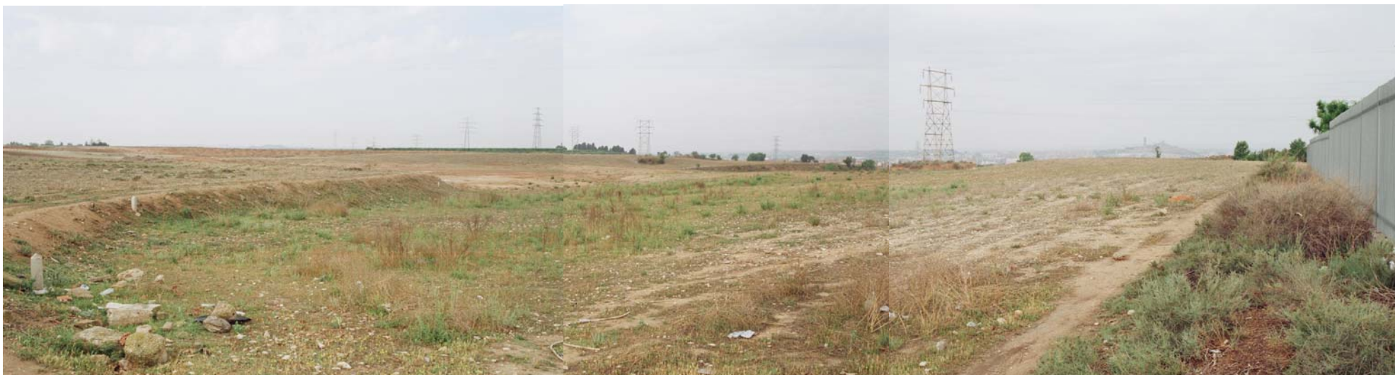
Vista des de la tanca del Col·legi Públic dels Mangraners. Fites de delimitació de La Paeria.