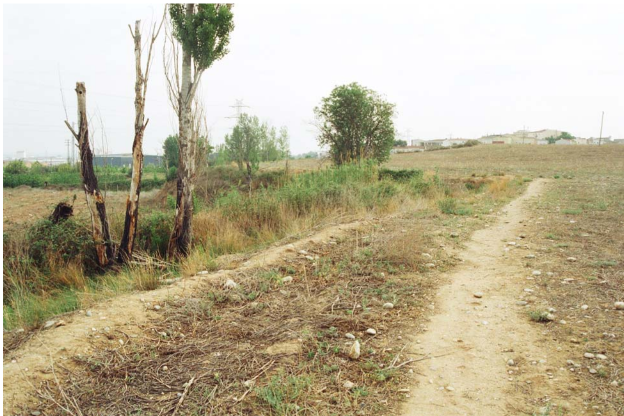
Sèquia en desús que voreja el sector pel sud-oest. Barri dels Mangraners al fons.