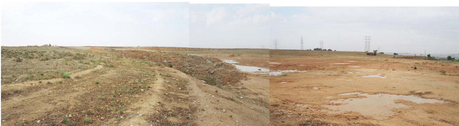
Vista des del Sud-Est en direcció Nord-Oest (Lleida)