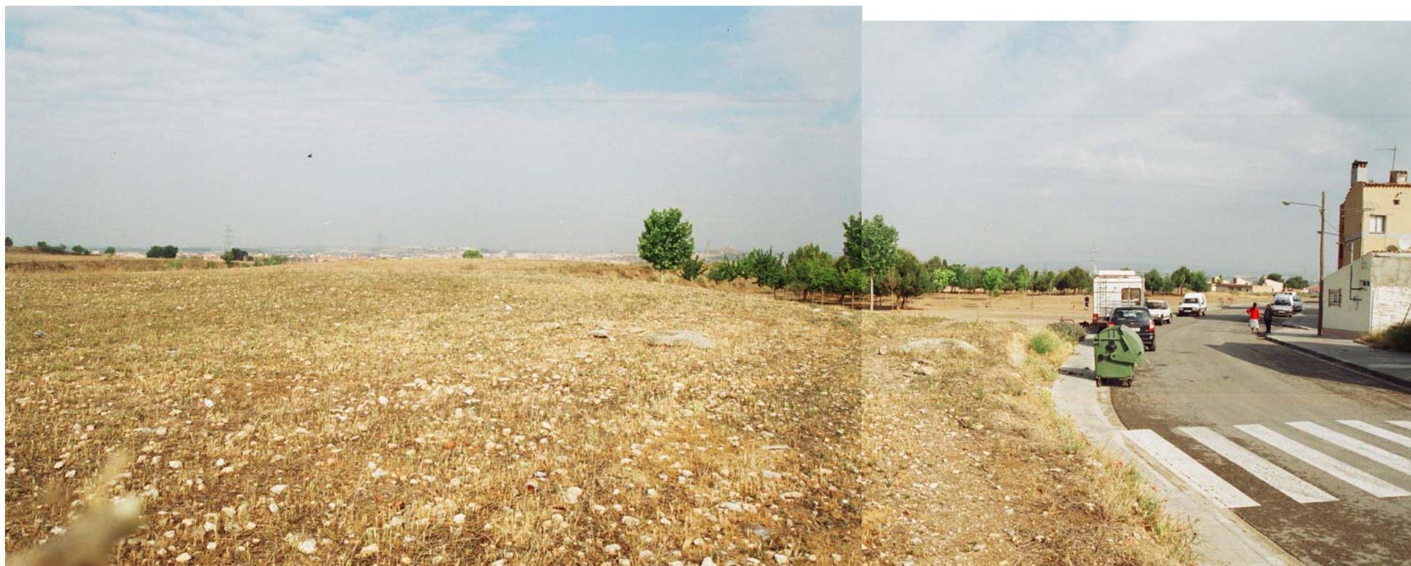
Límit amb el Carrer del Camp i amb la zona verda actual.