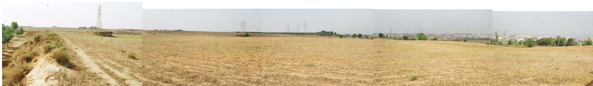
Vista des de la cota 201, al marge de la zona enjardinada que limita amb el Carrer del Camp