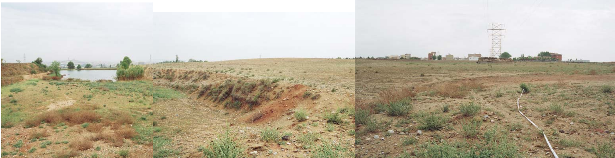
Vista des del Sud. Marge de l'àmbit del terreny amb la bassa de reg. Vista del barri dels Mangraners i de les línies elèctriques que travessen el sector.