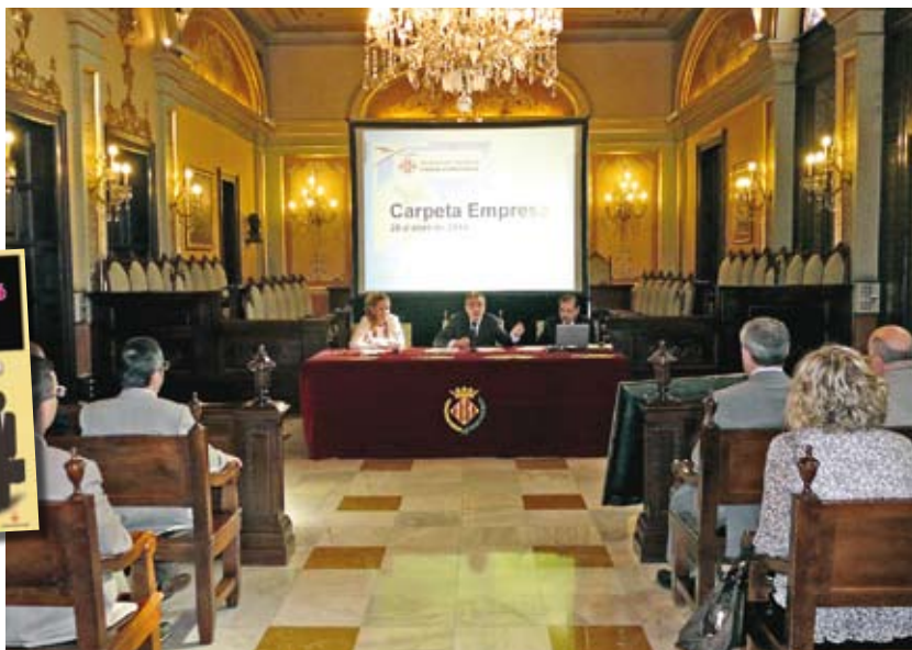
Presentació de la Carpeta Empresa al Saló de Plens de l'Ajuntament de Lleida