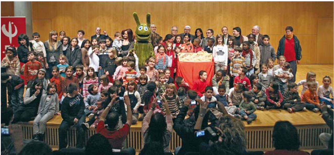
El caragol Banyetes va acompanyar els guanyadors i tots plegats van celebrar els 20 anys del concurs