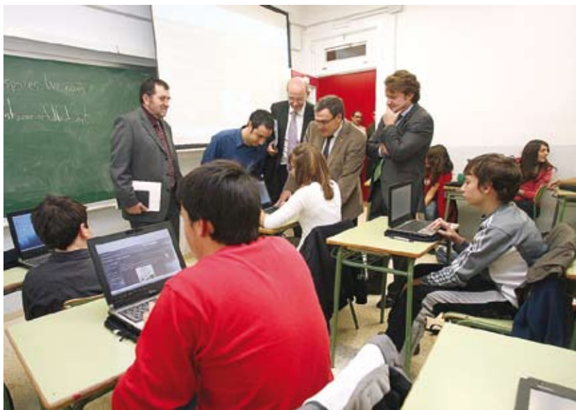
Visita de les autoritats a les aules de l'IES Manuel de Montsuar

L'Ajuntament de Lleida i l'Institut Municipal d'Informàtica són capdavanters en les estratègies, solucions i aplicacions de les tecnologies de la informació i les comunicacions a la gestió municipal. Molts d'aquests aplicatius han estat desenvolupats conjuntament amb empreses lleidatanes i multinacionals presents al Parc Científic i Tecnològic Agroalimentari de Lleida. Més de 40 ajuntaments, diputacions i organismes públics d'arreu de l'Estat utilitzen aquest programari.