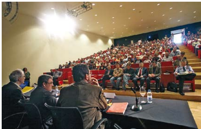
Inauguració de la jornada a la Sala Leandre Cristòfol de La Llotja