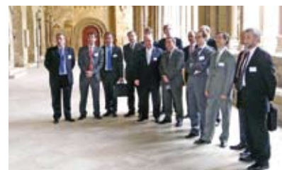
L'Alcalde i membres de l'empresa IFR