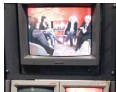
Montse Mínguez i usuàries dels telecentres al plató del 'Cafeïna'