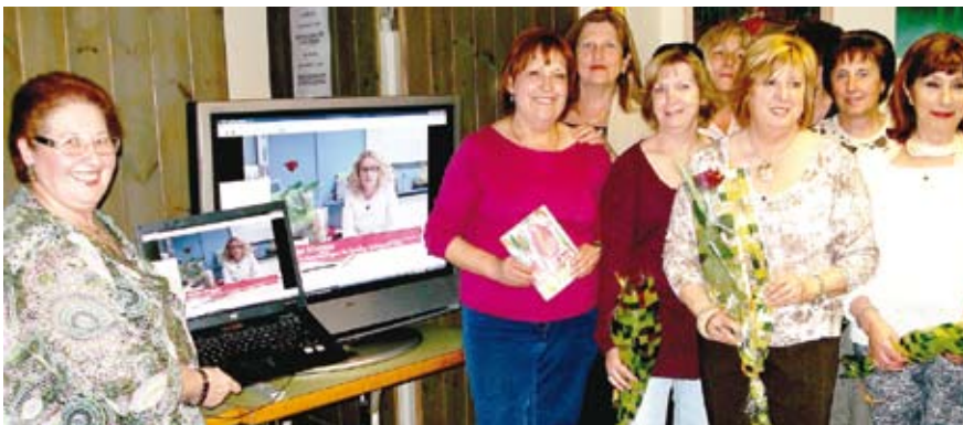
Presentació de la revista i felicitació de la regidora mitjançant un vídeo 2.0